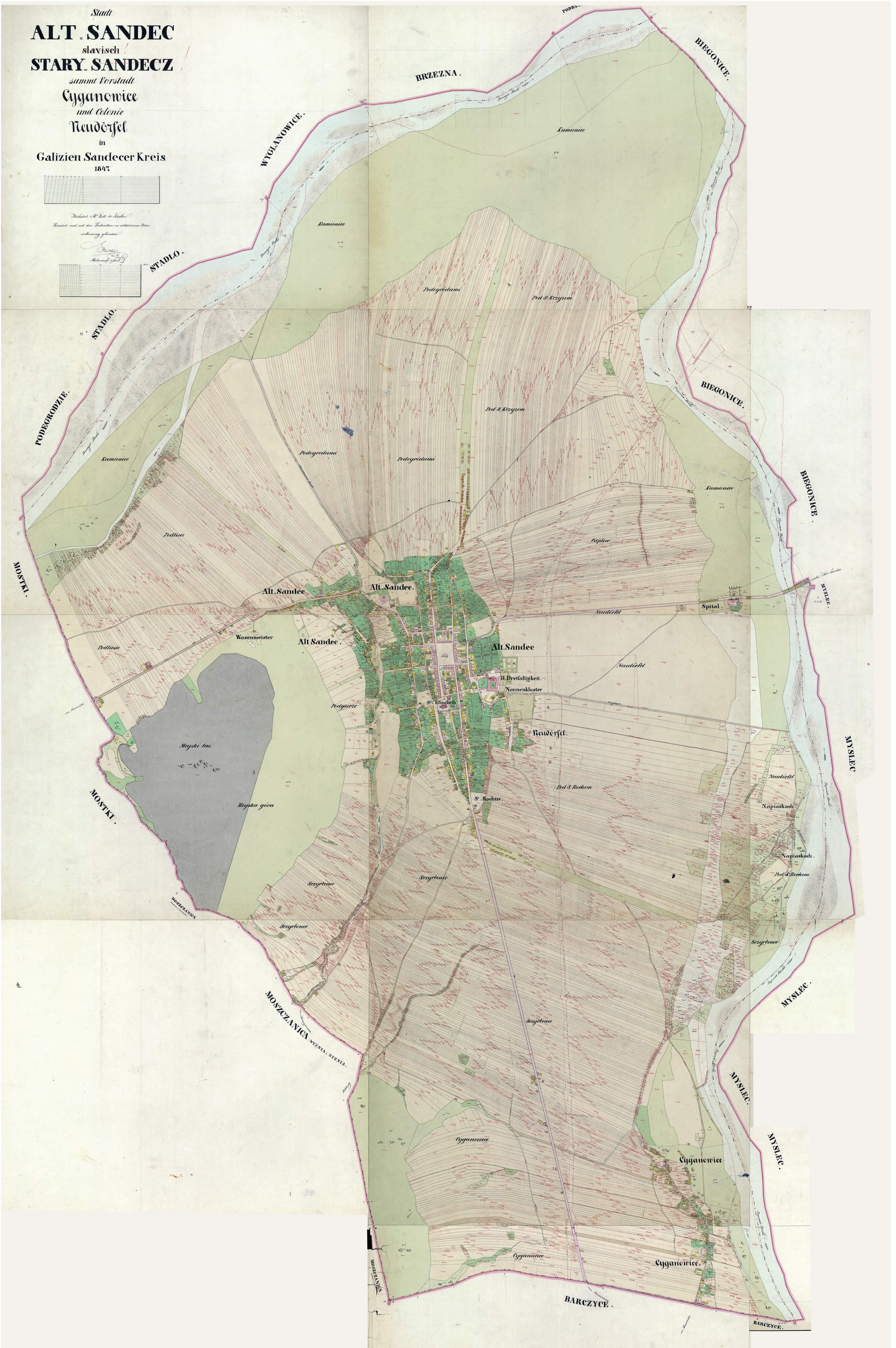
1.1.A. Stary Sącz, plan katastralny, 1847 Cadastral map of Stary Sącz, 1847