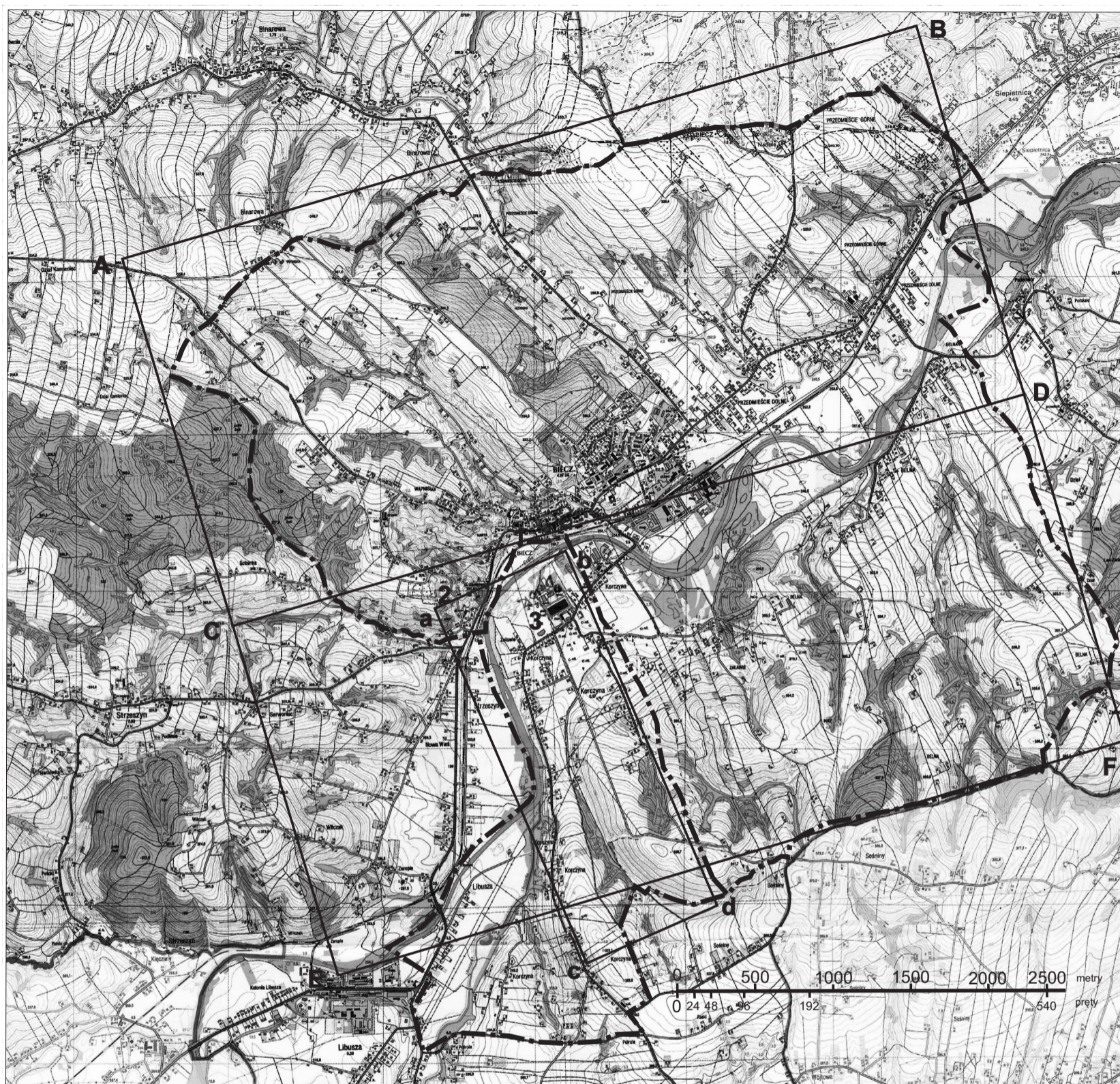
Reconstruction of the chartered urban layout (after the town incorporation). The borders of Biecz and Korczyna as marked on the cadastral plans of 1850

ABCDEF – demarcation of two farmland areas, 50 lans each (1200 × 540 rods)